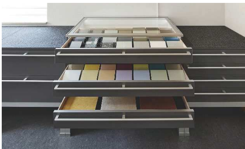
Eine große Auswahl an Mustern lässt sich einfach aus der Schublade ziehen. Die ehemalige Altbauwohnung wurde renoviert und zu einem Showroom mit wirkungsvollem Beleuchtungs- und Farbkonzept umgebaut

Das Highlight der Ausstellung ist die Wohn-Werkstatt. Oder wie Freymark sagt: „Eine ganze Bibliothek voll Materialien.“ In 25 Berufsjahren hat sich der gebürtige Münchner zum Spezialisten für ganzheitliche Raumgestaltung weitergebildet. Zunächst bei TopaTeam, später beim Handelspartner Eichenhaus. In dieser Zeit ist der umfangreiche Fundus an Fachwissen stetig gewachsen. Heute steht eine Vielzahl an Bemusterungen zur Wahl. „In unserer Ausstellung sieht der Kunde Materialien, von denen er vielleicht nicht einmal wusste, dass es sie gibt oder dass man sie für die Raumgestaltung einsetzen kann“, so der Schreinermeister. Beim Erstgespräch im Showroom wählt der Kunde mithilfe einer Materialcollage seinen persönlichen Wohnstil aus. Ob »