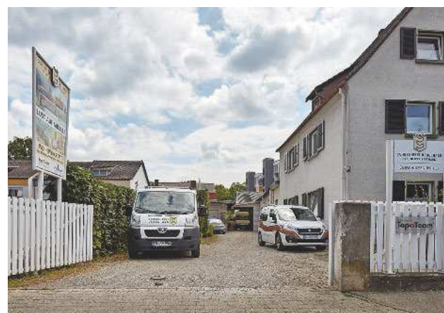
Die Möbelausstellung der Schreinerei Uebelhack befindet sich in einem separaten Altbau auf dem Firmengelände. Mit guter Anbindung an öffentliche Verkehrsmittel