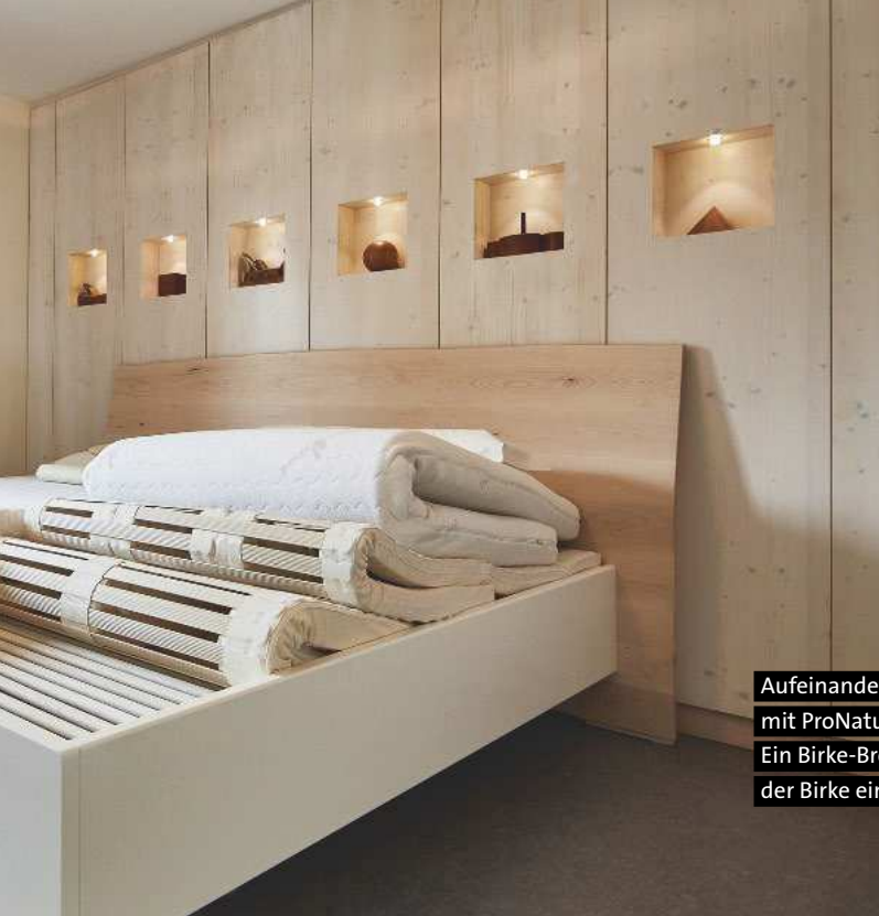
Aufeinander abgestimmte Einrichtungslösungen aus einer Hand: Schlafraum mit ProNatura-Schlafsystem und Einbauschränk aus der Schreinerwerkstatt. Ein Birke-Brett setzt Akzente an diesem Schrank. In der Nische bildet die Rinde der Birke einen außergewöhnlichen Blickfang, mit LED-Leuchte