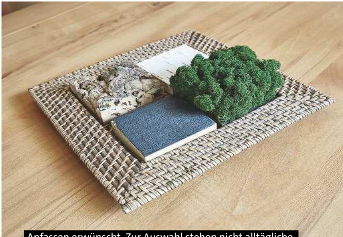
Anfassen erwünscht. Zur Auswahl stehen nicht alltägliche Materialien wie zum Beispiel echtes Moos. Ein haptisches und optisches Erlebnis